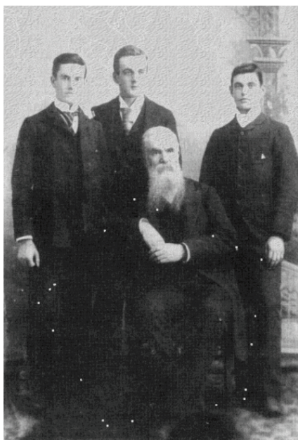
傅兰雅与其三子合影 (时为 1892 年)

傅兰雅 (John Fryer, 1839-1928), 英国人, 长期供职于上海江南制造总局翻译馆, 1896 年出任美国加州大学伯克利分校首任东方学教授, 休假期间仍时常回中国继续从事译书的工作。综计下来, 傅氏编译的各类西学著述达 150 余种, 在清末社会中曾产生过极为广泛的影响, 梁启超、康有为、鲁迅、茅盾等人皆大量阅读过傅氏的译著及期刊, 这些久为研究者所熟知。1912 年, 中华民国政府成立, 随着留学生的大量回国, 由外国传教士主导的西学中译时代成为过去时, 但对于中国而言, 傅兰雅并不想成为过去时, 他一直在寻求为中国人服务的新途径。