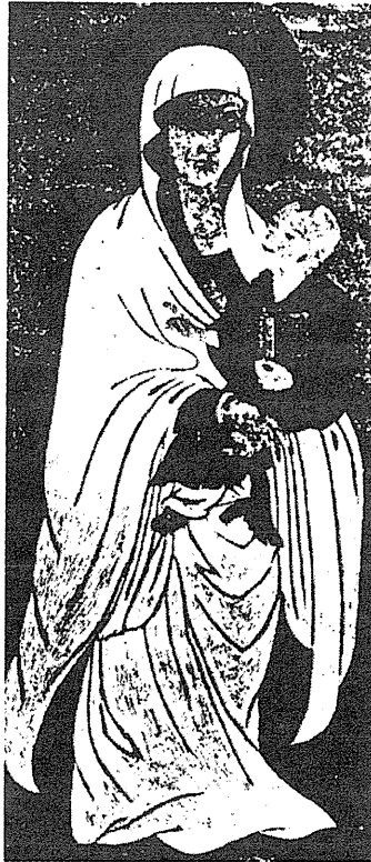
1600年ごろの中国の聖母

サンタ・マリア・マッジョーレ教会で崇められているマリアの奇跡的な聖像「ローマ人の救済者」を模写させる許可を最初にとった人であった。「とりわけ〔イグナチオ・デ・アゼヴェードが〕ポルトガルの女王に、尊きボルジアの名において、聖ルカの手で描かれ、雪のサンタ・マリア教会〔訳注：サンタ・マリア・マッジョーレ教会の別称〕に祀られている神の母の画像の模写を贈った。まず、ボルジアの指揮のもと、ともかくその記憶が残り続けるようにと、さきに誰かに真似られるまえにこの聖なる画像の模写がなされたのだった。そして尊敬すべき聖母が増えるにともなって、あれほど多くの画像がばらまかれたのである。」(SACCHINI, Historia Societatis Iesu , III, lib. V, n 296, Roma, 1640, 263-264)「ローマ人の救済者」の複製をつくらせることに対する聖フランチェスコ・ボルジアの絶対的な優先権に関するこの簡単な所見は、最近セップ・シュラー博士が提起した仮説 (SEPP SCHÜLLER, Die «Chinesische Madonna», der bedeutendste Fund aus der erstern Missionsperiode in China , in Die katholischen Missionen , Bonn, 1936, 177-183) をあきらかに無効とする。仮説によれば、この中国の聖母のオリジナルは中世 (十三世紀~十四世紀) にフランシスコ派の開拓者の誰かによって中国にもたらされたかも知れぬ、というのだ。これらの模写の一枚が聖フランチェスコ・ボルジアからイグナチオ・デ・アゼヴェードに与えられ、もう一枚が同じ人物によって、上に引いたテキストでサッキーニが明言しているとおり、デ・アゼヴェードの手を介してポルトガル女王カテリーナに届けられた。1569年7月2日、聖人は上述の王女に書いている、「〔デ・アゼヴェード師〕があなた様にお持ちする画像は、神の母に対する信仰篤き女王が持ちうるもっとも素晴らしいものの一つだと思います。というのもそれは、聖ルカによって描かれ、最大限の崇敬を集めているサンタ・マリア・マッジョーレ教会にあるものと同じ肖像だからです。」(MHSI, Borgia , V, 113)