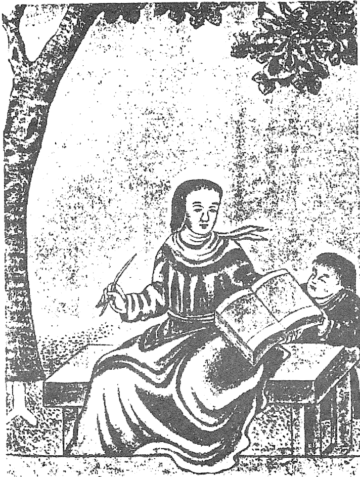
聖マタイ? ラウファーの画集より

リッチが墨職人に贈った四枚の聖像を最初に公表したのもラウファーその人で、同じ論文においてであった。1605年の末か1606年の初め、北京に落ち着いて(1601年1月24日)から