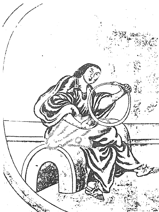
福音史家聖ヨハネ? ラウファーの画集より