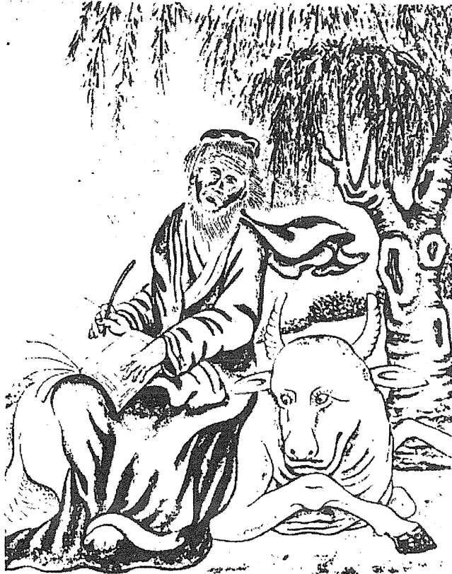
聖ルカ ラウファーの画集より

まだ五年も経たないころに、リッチは中国墨の職人の訪問を受けた。その人は安徽の徽州の近く、歙縣の町に生まれ、程大約、幼博、篠野、君房という名であった。かれは有名人の自署を愛好し、それを自分のつくった固型墨の上に模刻するのが常であった。それどころか、ニスと油煙をもって墨を作るこのやり方は自分の発明だと言い張っていたが、すでに葉夢得 37 が十二世紀のはじめの『避暑録話』において、三十年前になされた発明として語っている 38 。というわけで、四年前から北京に暮らしてその名声たるや帝国中に知れわたっている偉大なる西洋人の話を聞きおよんだ程大約は、リッチの親友で祝石林という名の南京の官僚の紹介状を手この宣教師のもとを訪れ、自分の墨に模刻するためになにかの西洋の筆跡をくれと頼んだのであった。そうすればより高く売れるかもしれないのだ。