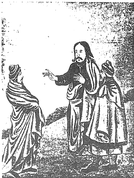
パリサイ人と徴税人のあいだのイエス ナダル『福音書の注解と瞑想』より N. 130, p. 502 以降