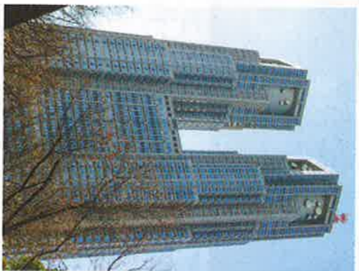
都はビッグサイトの使用期間短縮を検討している

東京五輪開催に伴い、東京都は、ビッグサイトの使用期間を短縮することを検討している。これは、会場周辺の開発を進めるためである。また、東京都は、ビッグサイトの使用期間を短縮することを検討している。これは、会場周辺の開発を進めるためである。