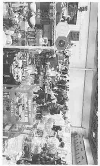
▲東京ビッグセンターには企業・一般の双方が訪れる