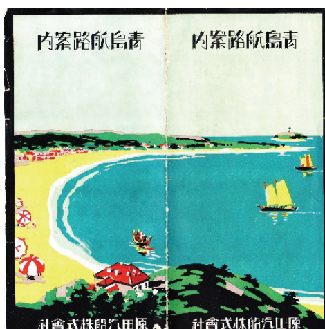
表2から原田丸は、神戸出港がほぼ13日間隔で運行されていたことがわかる。1934年4月初めに原田丸にかわって照國丸が代行しているが、昭和9年の一年間に27航海を行い、照國丸の一回を除いて、26航海を原田丸一隻がおこなっていた。原田丸は出航日の午前11時に神戸を出航し、翌日の午前中に門司に寄港し、門司を午後1時に出航して青島へ航行した。極めて正確な定時運航であった。同航路を原田汽船とともに運行していた日本郵船会社と大阪商船会社とともに正確な定時運航を実施していた。 18