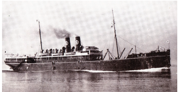
原田丸 「青島航路案内」より

先に紹介した出版年不明で昭和初期のものと思われる原田汽船株式会社「青島航路案内」の支店として「青島山東路八十號」の所在地が、 20 1933 年（昭和 8）11 月発刊の原田汽船会社編「青島航路案内」では「青島中山路八十二號」と移転したことがわかる。そして、両航路案内においても「航海日数と湮程」によると、汽船は原田丸總噸数 4,109.31 噸、速力毎時十五海里であり、収容船客一等 36 人、二等 42 人は同じで、三等は前者が 162 人であるのに、 21 昭和 8 年版が 177 人と増加している。