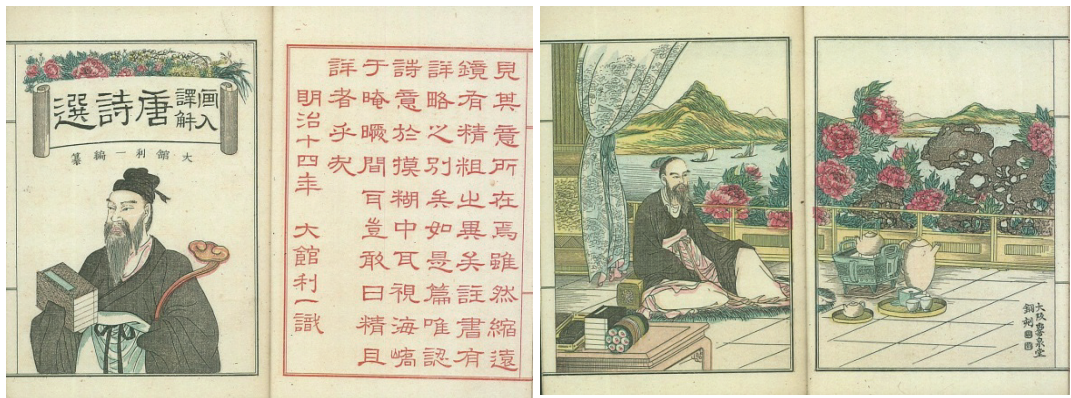
『画入譯解唐詩選』明治14年(1881)大阪府立中之島図書館蔵

このような江戸時代における「唐詩」流行の要因の一つが『唐詩選』関係の多くの書籍の出版となったことは想像に難くない。