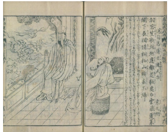
『唐詩選画本』寛政2年（1790） （国立国会図書館所蔵本）

と記されている。唐代の玄宗の先天元年（712）から代宗の永泰元年（765）までの約 50 年が唐詩の黄金期とされる盛唐時期の唐詩は、「高妙」で、初心者には理解が難しいため、中唐、晚唐の詩を理解した上で、盛唐の詩を学ぶようにとの簡単ではあるが、唐詩を学ぶ人々への指南を記している。